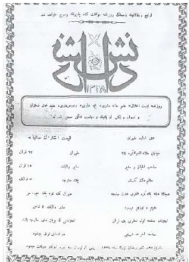
تصویر شماره ۴: سر صفحه نشریه دانش